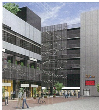
E棟・ビルボードサイン