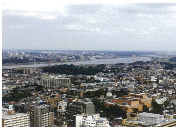
D棟屋上から手賀沼を臨む

D棟は、上棟が済み屋上の最高高さまで達した建物の偉容は、人々の注目を集めています。1・2階の各区画には仕切り壁が設置され、壁・天井内の設備工事及び店舗内装工事に着手しているところです。