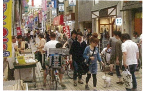
商店街のにぎわい(イメージ)

各店舗区画の内装工事に着手し、いよいよ開業に向けた準備作業が本格化してきます。建物の引渡し後は、D・E街区それぞれ管理組合を組織し、管理運営業務を行います。両街区とも、既に業務委託をする管理会社を決定していることから、引渡し後に向けた準備をどのように行っていくか、調整をしていく必要があります。