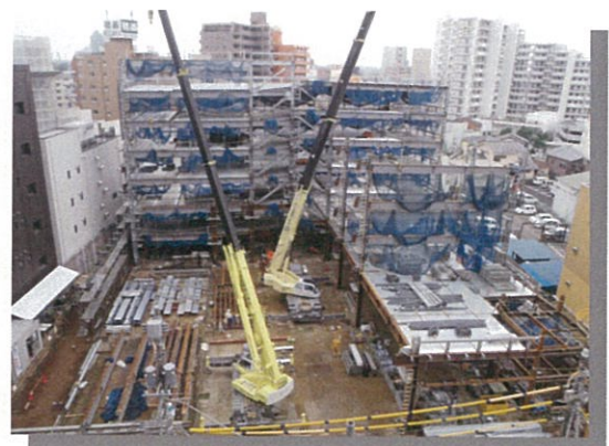
南通り側から見たE棟