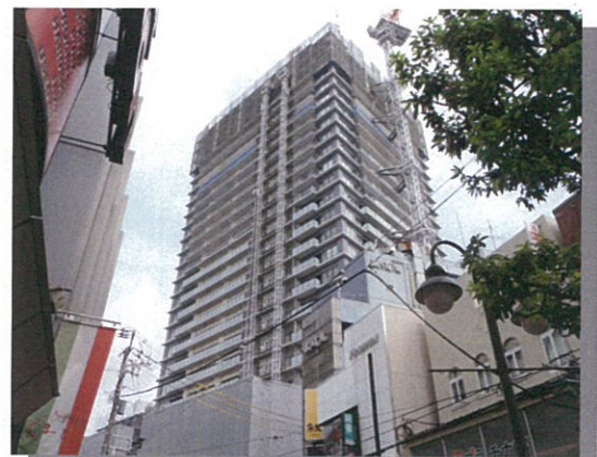
南通り側から見たD棟