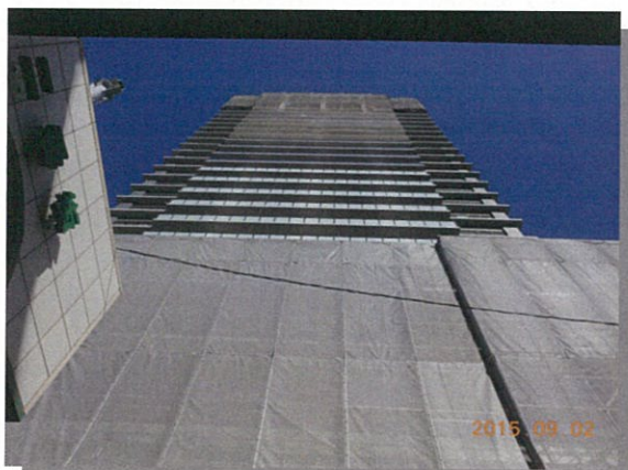
二番街側から見たD棟