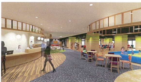
(仮称) 柏市民交流センター