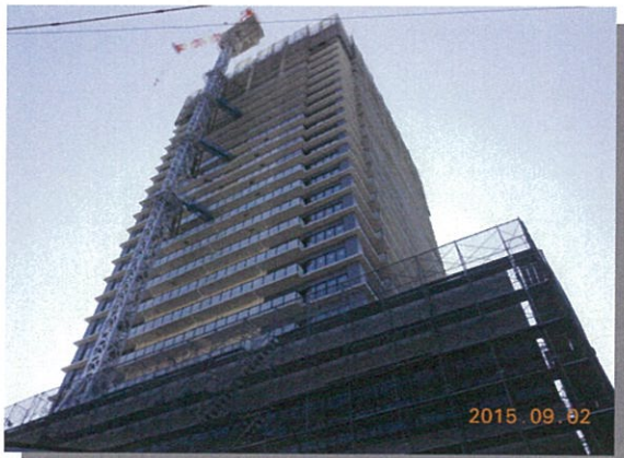
中通り側から見たD棟

施設建築物（D棟・E棟）の外観写真をお知らせします。柏市の新しいランドマークとして、市民から親しまれる施設となっていくことと思います。