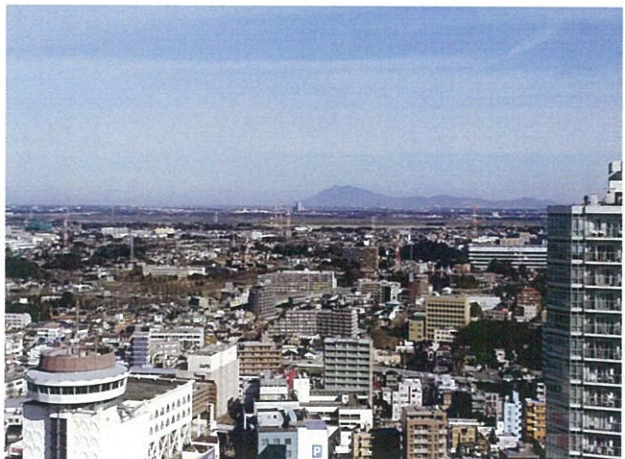
Day Oneタワー屋上から筑波山を臨む

新年明けましておめでとうございます。 市街地再開発事業が竣工して初めての新年を迎えました。昨年末には清算交付金の支払いを終え、再開発組合は本年3月末の解散を目指しています。組合の解散認可後は、法人としての清算事務に4か月ほどかかります。したがって、7月末には事務所を閉鎖する予定です。それまでに全業務が滞りなく遂行できることを願っています。