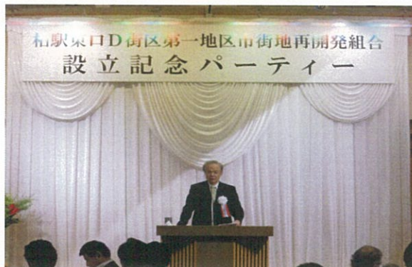
組合設立記念パーティー（24年8月）

構想以来30年の長きにわたり、夢であり懸案であった柏駅東口D街区第一地区第一種市街地再開発事業が竣工し、昨年4月28日に施設建築物の引渡しを受けました。再開発組合の設立（平成24年8月）から竣工・引渡しまでを振り返ってみました。