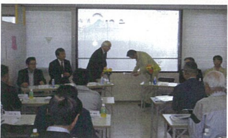
竣工・引渡し（28年4月）