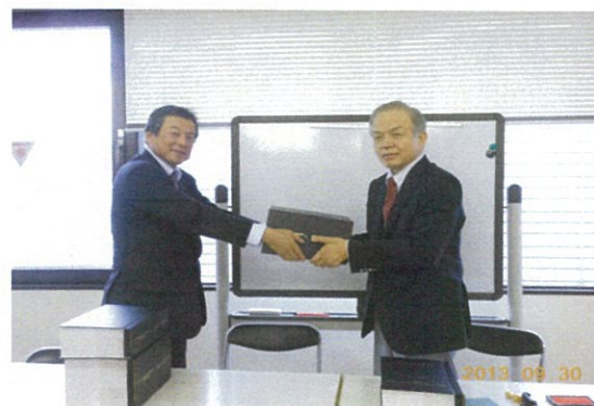
工事契約締結（25年9月）