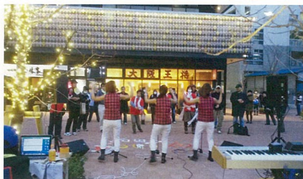
商店会の活動（左・柏まつり、右・クリスマス）